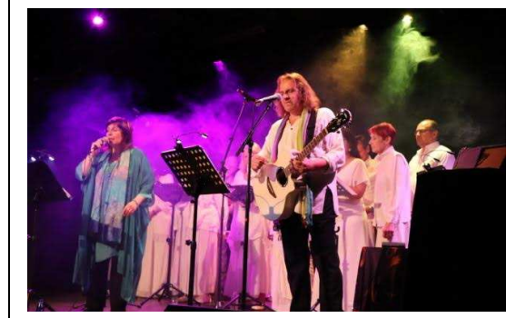
Concert au théâtre des feux de la rampe (Paris)