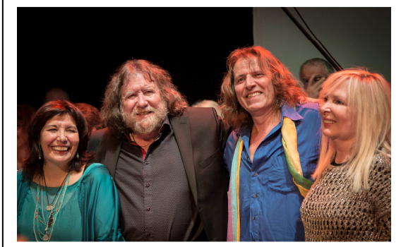
Soirée au théâtre d'Aix en Provence